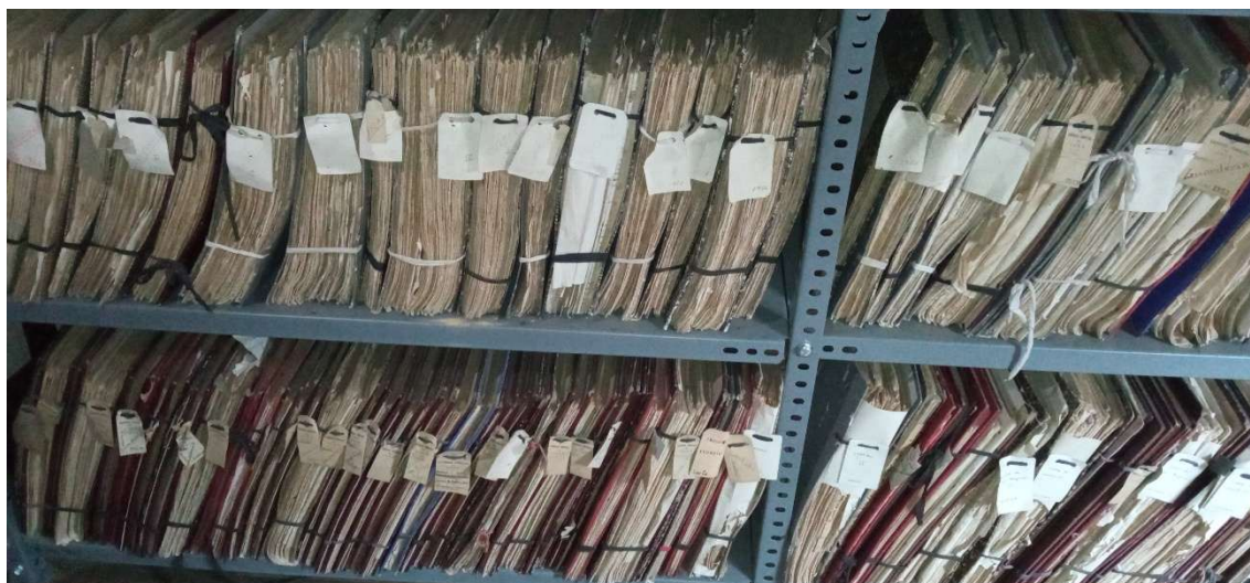
Figura 2. Fondo Documental del Monte Gallego. Vivero de San Breixo (Lugo). REMP.

Todas las administraciones forestales reseñadas anteriormente generaron cuantiosa documentación forestal.