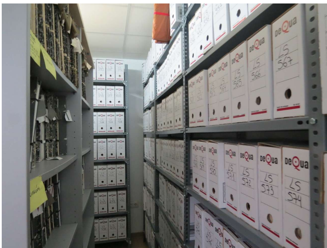
Figura 1. Fondo Documental del Monte Gallego. Vivero de San Breixo (Lugo). REMP.

El Fondo Documental del Monte Gallego creó una metodología para clasificar, conservar y mantener documentación forestal en espacios de la Conselleria del Medio Rural, lo que facilitó el desarrollo del Portal del Fondo Documental del Monte Gallego, centralizando y mejorando el acceso a esta información especializada.